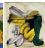
Christian Bonnefoi Sans titre (détail) série P.L.I.I. Acrylique sur toile Inv. n° 995112