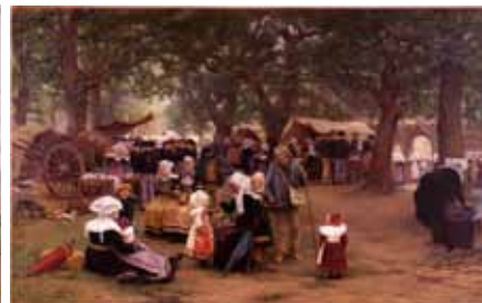
Théophile-Louis Deyrolle Pardon de Méros, près Concarneau vers 1884 Huile sur toile