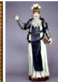
Anonyme Saint Guillaume, patron des prisonniers XVII e siècle, Bretagne Bois polychrome