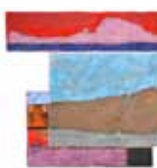
Jean Veaugeois Fragments de baie Technique mixte sur bois Inv. n° 2015.21