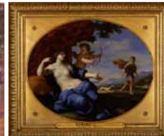
Giovanni Francesco Romanelli Vénus et Adonis début XVII e siècle Huile sur toile