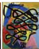
Charles Lapicque Le naufrage © Adagp, Paris, 2018 Huile sur toile Inv. n° 98661