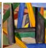
Alain Clément Sans titre © Adagp, Paris, 2018 Huile et acrylique sur toile Inv. n° 997411