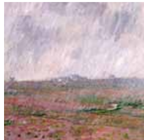
Claude Monet Pluie à Belle-Île 1886 Huile sur toile