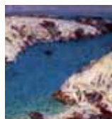
John-Peter Russell Le port de Goulphar sous la neige (détail) 1898 Huile sur toile Musée d'Orsay, dépôt au musée de Morlaix Inv. n° D9971114

Alexis de Tocqueville, De la démocratie en Amérique , 1835