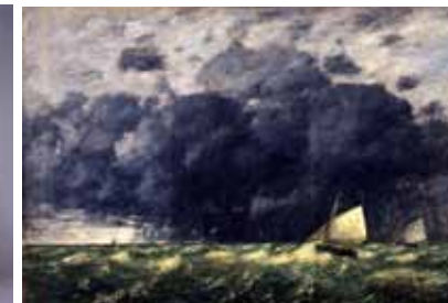
Eugène Boudin Un grain 1886 Huile sur toile