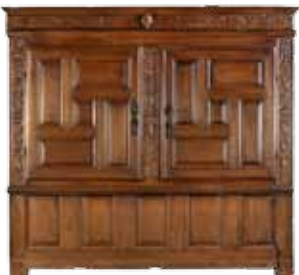
Presse à lin XVII e siècle, pays de Léon Bois de chêne