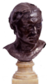
Auguste Rodin Madame Russell 1889 Argent patiné, piédouche onyx blanc Musée d'Orsay, dépôt au musée de Morlaix