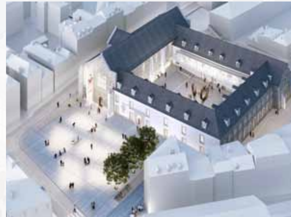
Vue aérienne sur le parvis et l'entrée principale du musée des Jacobins

Le projet du nouveau musée vise à doter la ville de Morlaix d'un équipement culturel dynamique ayant pour but l'éducation artistique et culturelle mais également l'étude, la conservation et la mise en valeur de sa collection composée de ses deux ensembles majeurs, peinture du XVI e au XXI e siècle et arts populaires, à travers l'histoire du territoire sur lequel il est implanté.