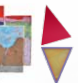
Claude Briand-Picard Sans titre © Adagp, Paris, 2018 Technique mixte Inv. n° 2000131