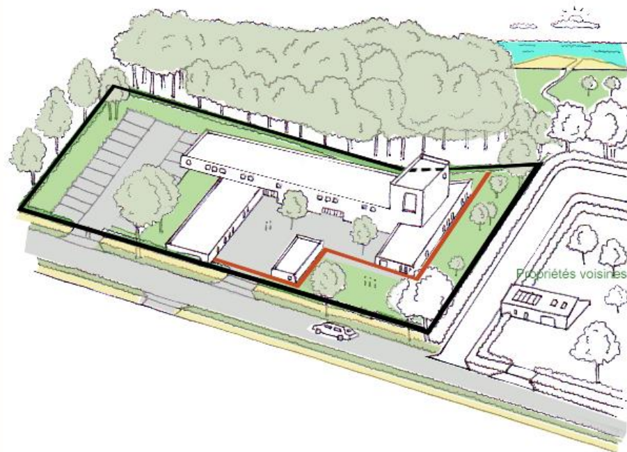
Schéma à titre illustratif